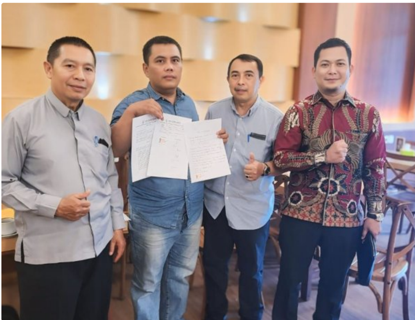
Kuasa Hukum Ningto Wahyu Dens & Partners Lawfirm di perkara Dugaan Pemalsuan Data dan Kredit Fiktif di Bank BRI Unit Kalideres.

JAKARTA, JNI - Seorang bekas nasabah Bank BRI, yang dikenal dengan inisial NW, melaporkan dugaan pemalsuan data dan kredit fiktif yang melibatkan oknum pegawai Bank BRI Unit Kalideres.